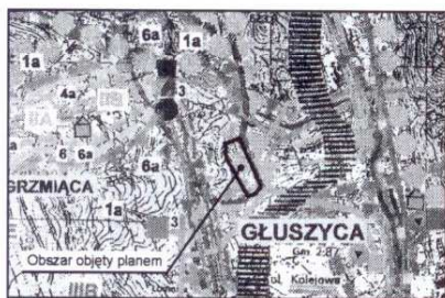
WYRYS ZE STUDIUM UWARUNKOWAN I KIERUNKÓW ZAGOSPODAROWANIA PRZESTRZENNEGO GMINY GŁUSZYCA