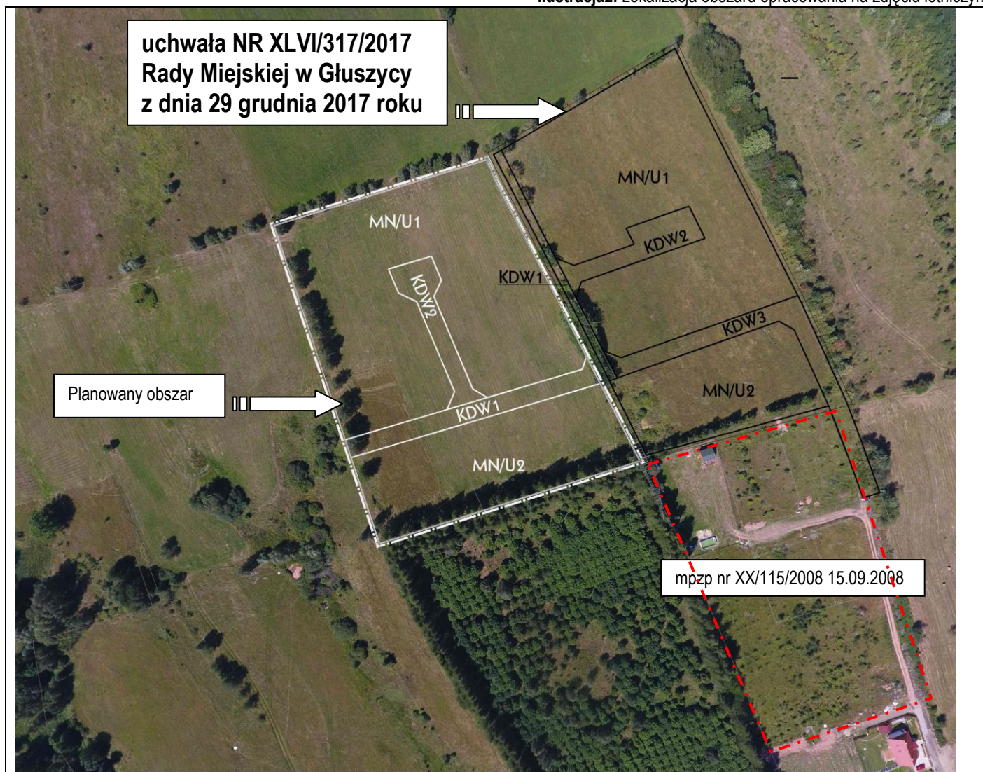
Ilustracja2. Lokalizacja obszaru opracowania na zdjęciu lotniczym.