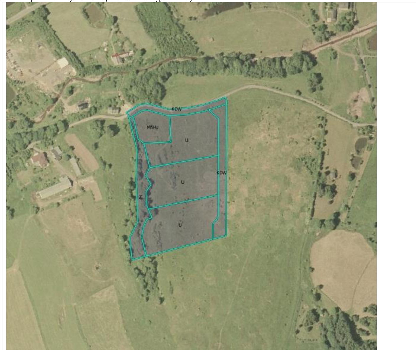
Ilustracja 2. Lokalizacja obszaru opracowania na zdjęciu lotniczym.