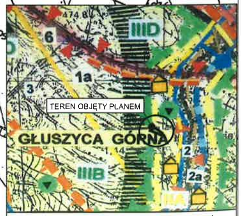
WYRYS ZE STUDIUM UWARUNKOWAŃ I KIERUNKÓW ZAGOSPODAROWANIA PRZESTRZENNEGO MIASTA I GMINY GŁUSZYCA