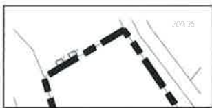
GRANICE OBSZARU OBJĘTEGO NINIEJSZĄ UCHWAŁĄ