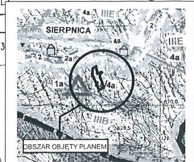
WYRYS ZE STUDIUM UWARUNKOWAŃ I KIERUNKÓW ZAGOSPODAROWANIA PRZESTRZENNEGO GMINY GŁUSZYCA