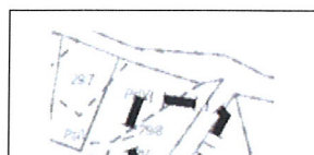
GRANICE OBSZARU OBJĘTEGO NINIEJSZĄ UCHWAŁĄ